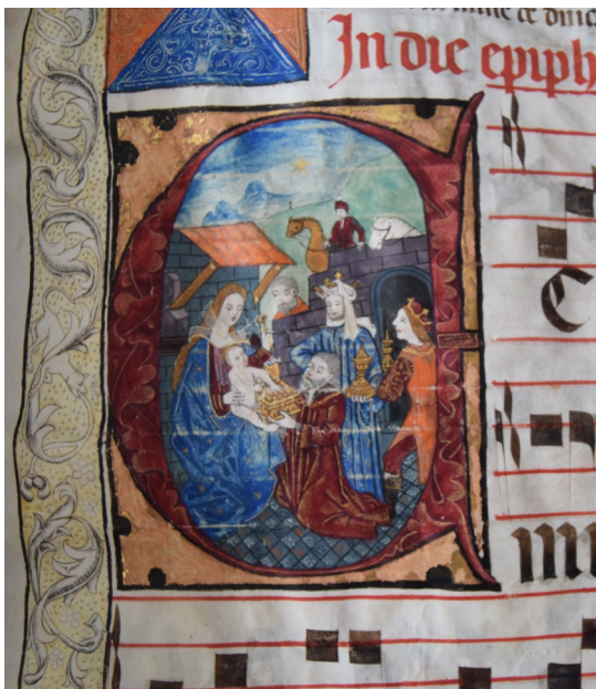
Iluminura que representa o Presépio, com 13 elementos da genealogia de Cristo. Antifonário para a Missa Nº 77.

O Arquivo Distrital de Évora vai-se associar ao Dia Nacional dos Bens Culturais da Igreja através de uma mostra documental a decorrer de 18 de outubro a 09 de novembro de 2018: