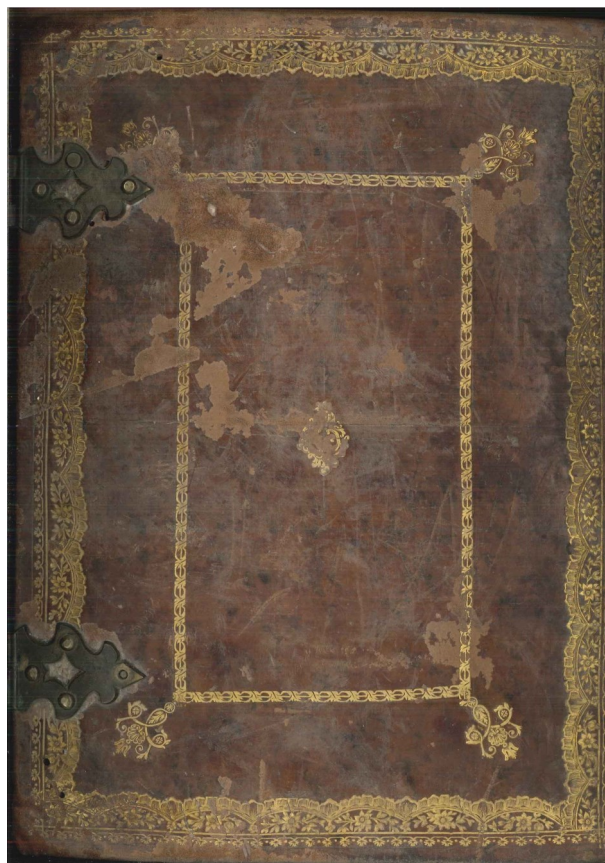
Missal da Santa Casa da Misericórdia de Évora Nº 2397.

Durante a mostra documental estarão patentes livros, documentos e imagens sobre a arte cristã: sermões, escrituras de empreitadas referentes a obras de entalhadores, de pintores e de ladrilhadores, iluminuras, inventários de bens e livros litúrgicos de Conventos extintos do distrito de Évora.