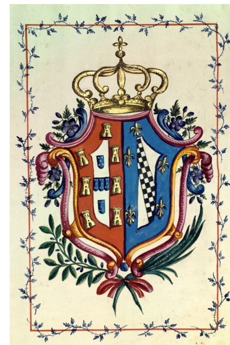
Livro de Liturgia Nº 15 (Convento de São Bento de Cástris)