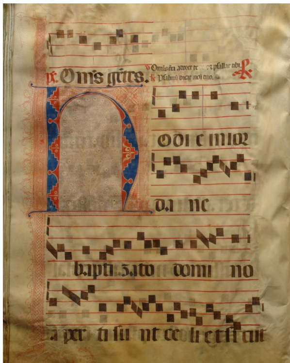
Livro de Liturgia Nº 54 (Convento da Cartuxa de Évora)

Inscrição até 18 de outubro, pelo mail@adevr.dglab.gov.pt